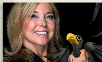
Gewinnerin des Deutschen Kleinkunstpreises 2018

Das gibt Ärger - Jetzt geht die Party richtig los. Die Kanzlersouffleuse rechnet entgeltlich mit ihrem Arbeitgeber ab, denn was Berlin mit Deutschland macht, das haut den stärksten Gaul um. Politisch korrekt war gestern, und so steht jetzt schon fest: Das gibt Ärger!