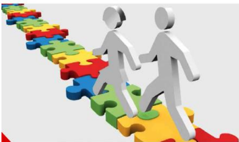
Kein Abschluss ohne Anschluss – Übergang Schule – Beruf in NRW.

Die Standardelemente zur Berufs- und Studienorientierung in der Sekundarstufe I werden seit 2013 erfolgreich umgesetzt. Jährlich nehmen rund 8.000 Schülerinnen und Schüler aller Schulformen an der Potenzialanalyse teil. Im Anschluss besuchen sie die Berufsfelderkundungen . 1.000 davon nehmen aktuell das Angebot der trägergestützten Berufsfelderkundung wahr, knapp 500 Schülerinnen und Schüler der Klassen 9 oder 10 die Praxiskurse .